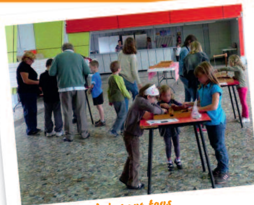
Jeux d'autrefois pour tous Famille rurale de Marcoing