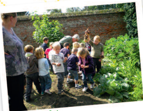
Semons solidaire Cattenières Animations Patrimoines

Le comité de gestion, composé d'acteurs locaux attribue une aide financière pour les projets associatifs comprise entre 500 et 3 000 euros.